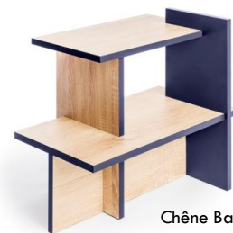
Chêne Bardolino bleu foncé