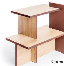
Chêne Bardolino terracotta