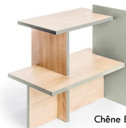
Chêne Bardolino Vert des champs