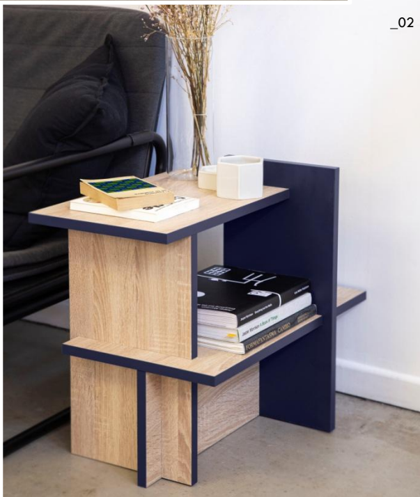
_02 BLOK – Chêne Bardolino - bleu foncé