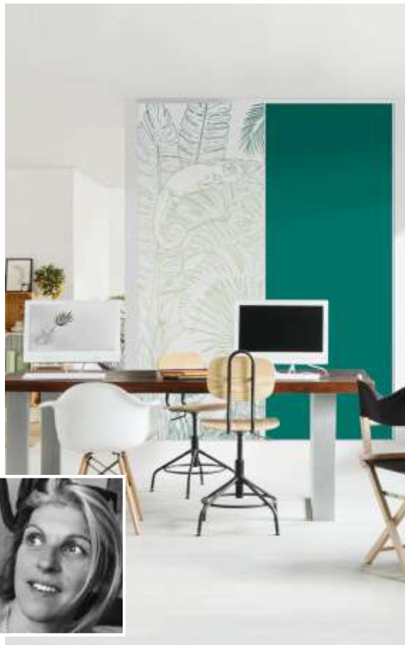
LE MODÈLE JUNGLE par Véronique Marchal

Portes coulissantes, modèle Jungle, collection Nature / modèle Vert tropical, collection Tendance.