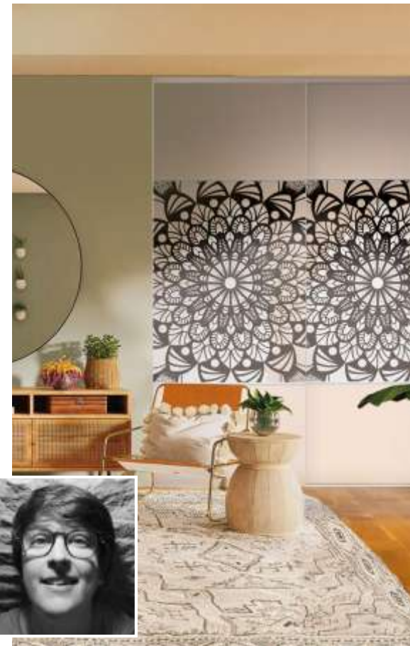
LE MODÈLE MANDALA par Julie Jeanne

Portes coulissantes, Sillage 1-2-1, Modèle Sable, collection Basique / modèle Mandala fond sable, collection Design.