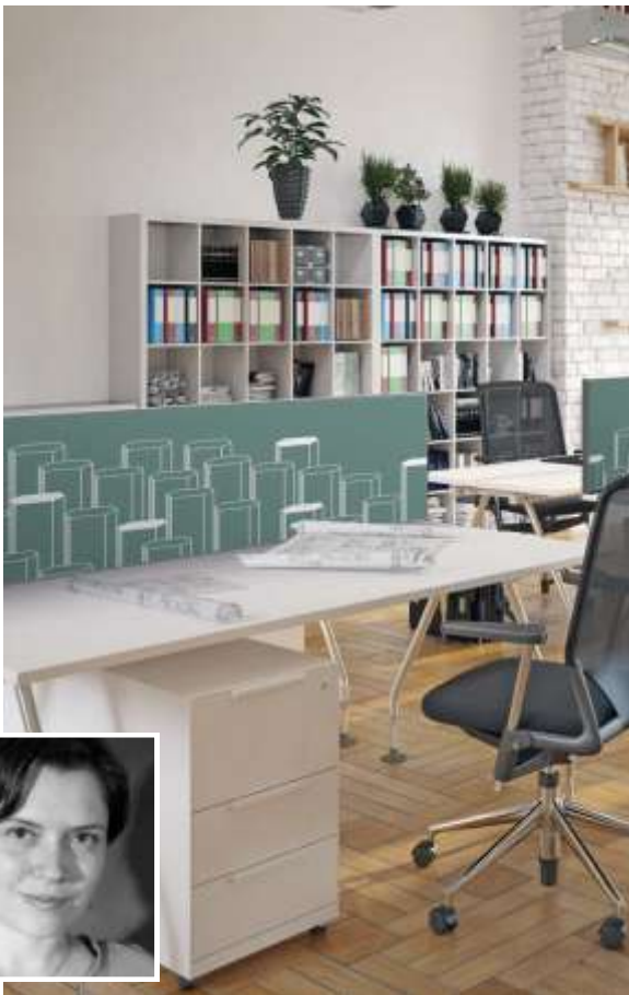
LE MODÈLE GÉANTS par Jennifer Posé

Séparateur de bureau, modèle Géants fond vert olive, collection Design.