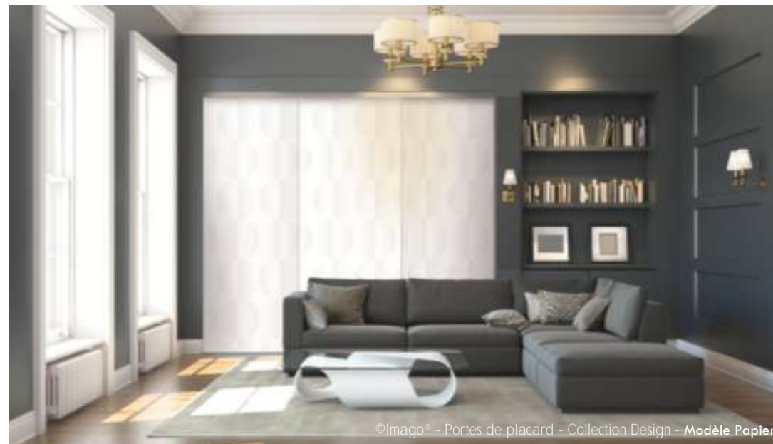
©Imago® - Portes de placard - Collection Design - Modèle Papier