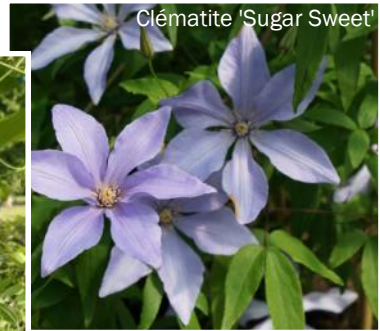
Clématite 'Sugar Sweet'