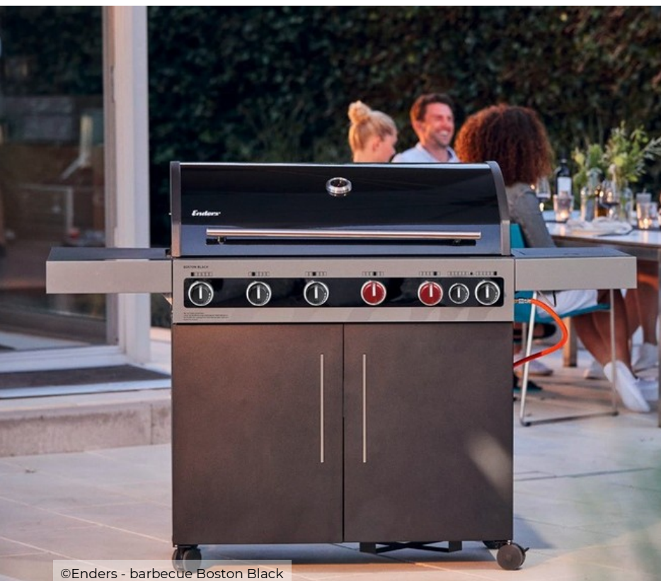
©Enders - barbecue Boston Black