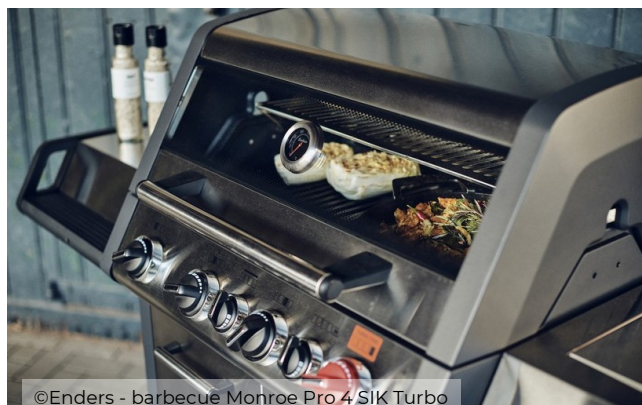
barbecue Monroe Pro 4 SIK Turbo

Favex, est une entreprise familiale française historiquement reconnue sur le marché des connectiques et accessoires pour bouteille de gaz depuis 1978. Elle s'est forgée une réputation de spécialiste dans l'industrie du GPL (butane-propane) et ce en devenant le 1 er fournisseur français de connectique pour bouteille de gaz . Ensuite, l'entreprise s'est diversifiée en concevant et commercialisant des produits manufacturés autour de 3 familles produits : le chauffage intérieur , la cuisson d'extérieur et les anti-moustiques sous les marques respectives Brasero et Mosquito Magnet.