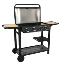
FLAVO 76 SC

Designée en France, notre nouvelle collection de barbecues gaz s'inspire du style Contemporain.