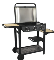
FLAVO 60 SC