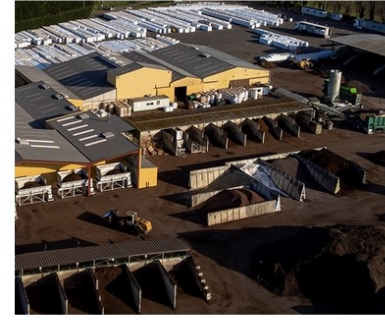
Rubrique : Végétal / Entreprises Partenaires