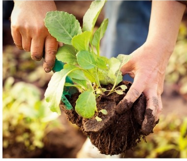
Communiqué de presse, le 31 janvier 2024