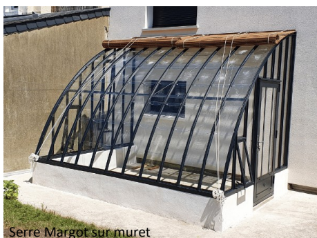
Serre Margot sur muret