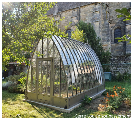
Serre Louise soubassement