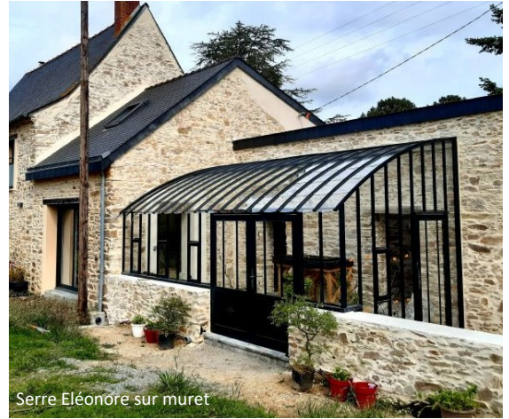
Serre Eléonore sur muret

Prix public généralement constaté : à partir de 7 890 euros TTC (livraison incluse, hors pose).