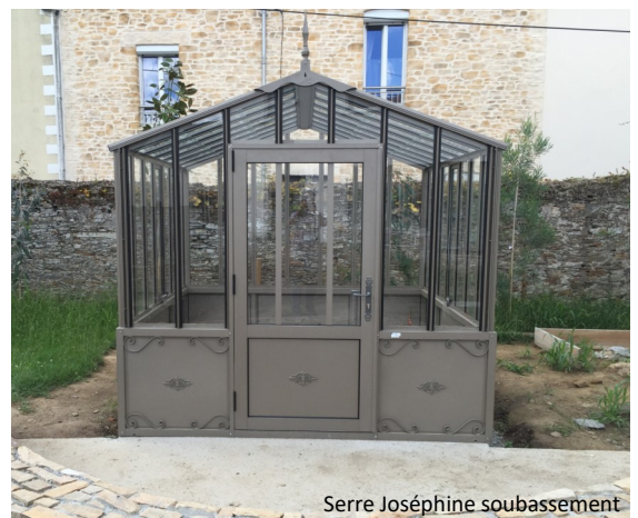
Serre Joséphine soubassement

Prix public généralement constaté : à partir de 6 990 euros TTC (livraison incluse, hors pose).