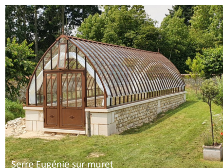
Serre Eugénie sur muret