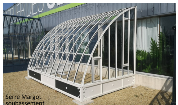
Serre Margot soubassement