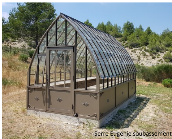
Serre Eugénie soubassement

Prix public généralement constaté : à partir de 9 200 euros TTC (livraison incluse, hors pose).