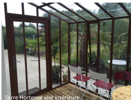
Serre Hortense vue intérieure