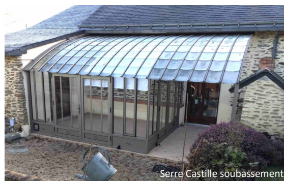
Serre Castille soubassement