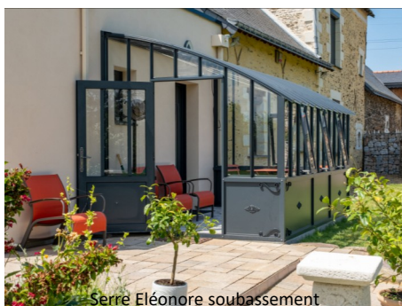
Serre Eléonore soubassement