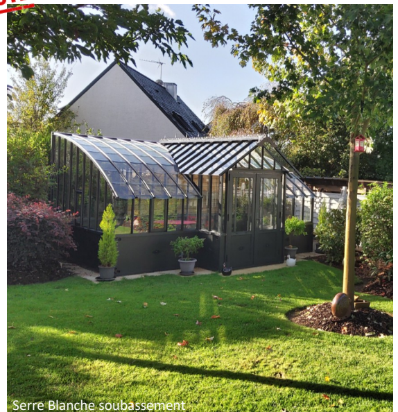
Serre Blanche soubassement