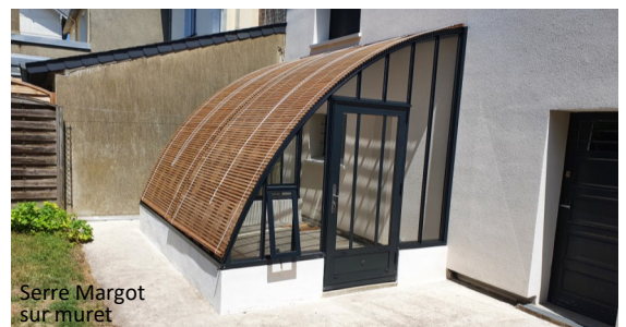
Serre Margot sur muret