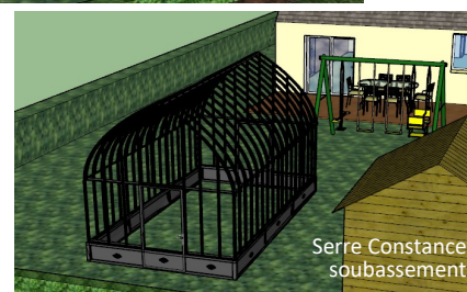
Serre Constance soubassement