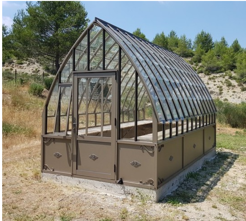
Serre Eugénie soubassement

L'Atelier des Serres, n°1 français de la serre de jardin multi-usages, développe tous les ans de nouveaux modèles venant élargir les deux gammes principales du fabricant : la serre de jardin d'antan et la serre comme pièce de vie adossée à la maison. Pas loin de 50 000 références sur 10 gammes , rappelons que l'entreprise est la seule en France à porter les 3 casquettes : celle de fabricant, distributeur et poseur sur la France et pays limitrophes. L'entreprise créée en 2014, connaît une croissance de 10 à 15 % tous les ans. L'engouement pour la maison et le jardin a été amplifié par le COVID, le consommateur se concentre sur l'essentiel pour mieux vivre et être bien chez soi .