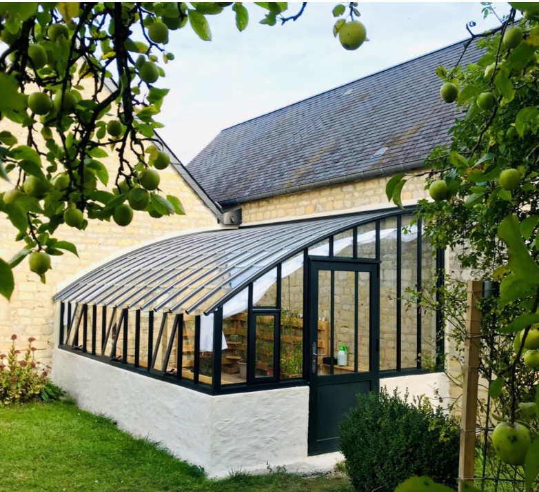
Serre Eléonore sur muret

À découvrir sur le STAND A42 - ESPLANADE au salon JdC Garden Trends du 26 au 28 mars au Parc Chanot à Marseille.