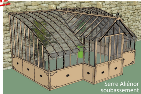
Serre Aliénor soubassement