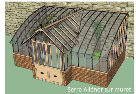
Serre Aliénor sur muret