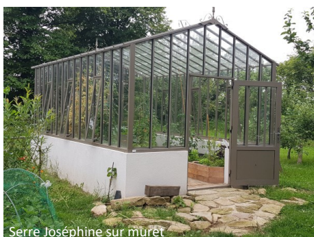
Serre Joséphine sur muret