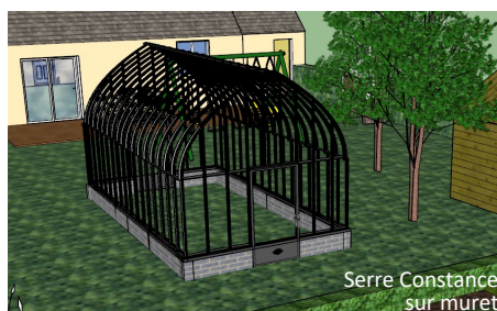
Serre Constance sur muret