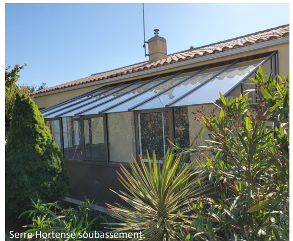
Serre Hortense soubassement

Prix public généralement constaté : à partir de 5 790 euros TTC (livraison incluse, hors pose).