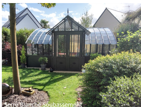
Serre Blanche Soubassement