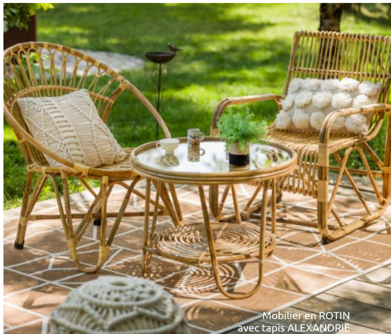
Mobilier en ROTIN avec tapis ALEXANDRIE

Prix public généralement constaté : de 59,90 € à 99,90 € selon la taille