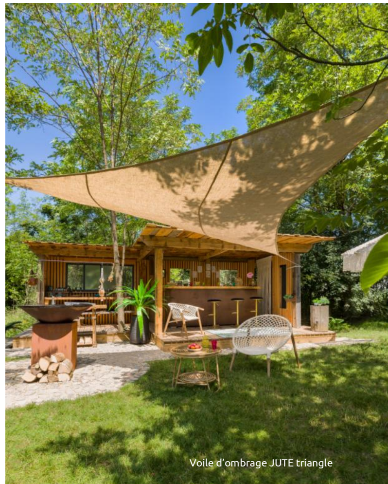
Voile d'ombrage JUTE triangle