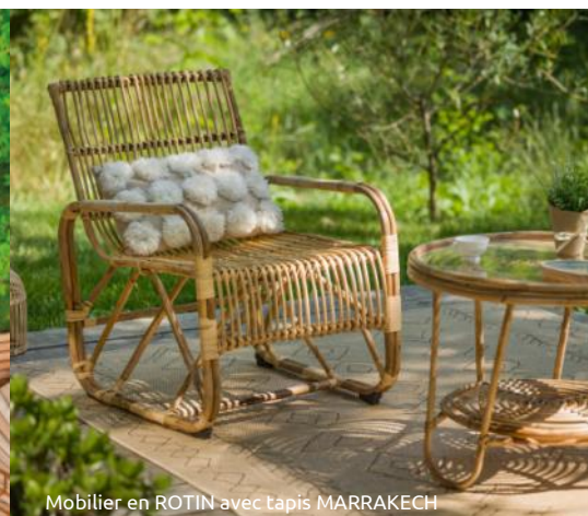
Mobilier en ROTIN avec tapis MARRAKECH