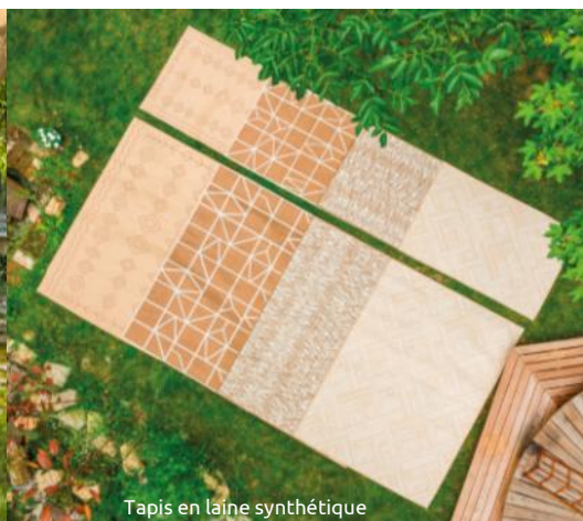
Tapis en laine synthétique