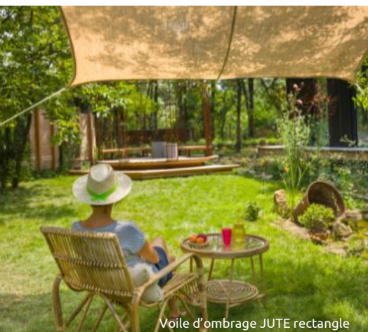
Voile d'ombrage JUTE rectangle