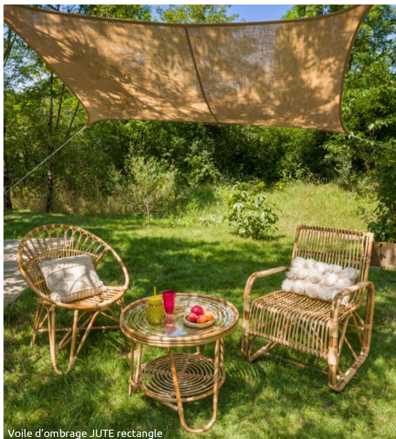
Voile d'ombrage JUTE rectangulaire

Ces matières sont en cohérence avec la politique RSE de l'entreprise. Elle doit rester vigilante sur l'origine des matières premières , afin de minimiser l'empreinte carbone des produits commercialisés en France. Par exemple, la fibre de coco est un surplus inexploité une fois le fruit récolté.