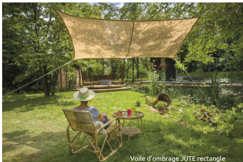
Voile d'ombrage JUTE rectangle

Les voiles d'ombrage en jute, symboles d'éco-conception, sont exclusivement distribués par JardiLine®, la marque de référence outdoor.