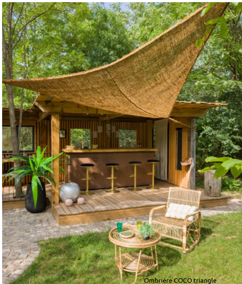
Ombrière COCO triangle

Ces produits sont disponibles en jardineries, en grandes distributions et vendus sur le site www.le-coin-deco.fr .