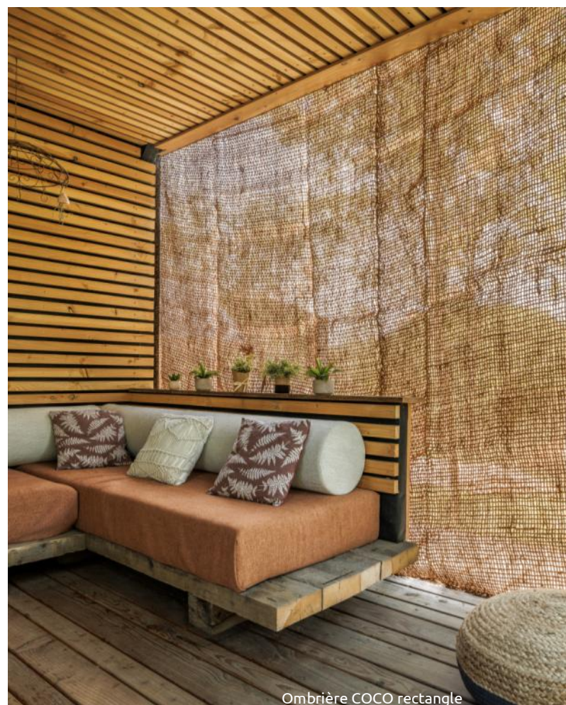
Ombrière COCO rectangle