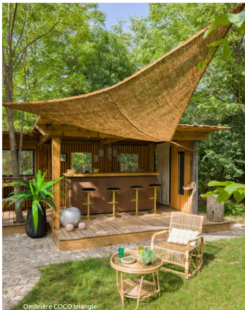
Ombrière COCO triangle

Dans le monde en constante évolution de la décoration et de l'aménagement extérieur, une marque française bien établie, JardiLine® , fait sensation avec ses dernières innovations . Celle-ci réputée pour ses produits de qualité et son engagement envers l'environnement , présente avec fierté ses nouveaux voiles d'ombrage en jute , ainsi que ses ombrières en coco . Plongeons dans le monde de l'outdoor avec ces nouvelles tendances alliant style et responsabilité environnementale .