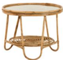
Table basse RINCA