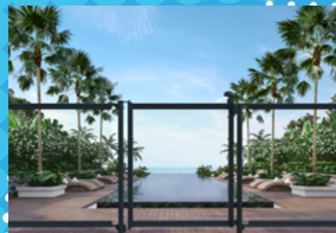
Barrières de piscine